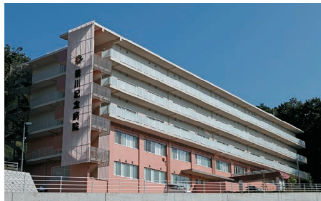
鶴川記念病院 救急告示指定 町田市三輪町1059-1 (180床)

川崎みどりの病院 鶴川リハビリテーション病院 大橋病院 京浜病院 新京浜病院 / 特別養護老人ホーム ヴィラージュ川崎 特別養護老人ホーム ヴィラージュ虹ヶ丘 / 看護小規模多機能型居宅介護/訪問看護ステーション ヴィラージュ虹ヶ丘 看護小規模多機能型居宅介護/訪問看護ステーション よろこび久末 / グループホーム ラポール高島平 / 訪問看護ステーション よろこび 訪問看護ステーション 長沢ひまわり 訪問看護ステーション 鶴川ひまわり 大橋病院 訪問看護ステーション ヘルパーステーション 青葉ひまわり / デイサービス 三輪 医療法人社団 檜会 川崎高津クリニック 医療法人社団 高輪会 新横浜デンタルクリニック