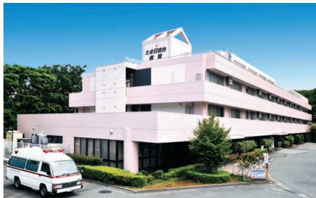
たま日吉台病院 2次救急指定 川崎市麻生区王禅寺1105 (199床)